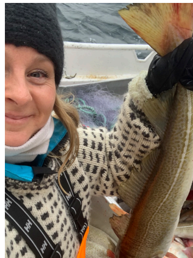
FISKEVÆR: Noe ganske annet enn et A4-liv i byen.